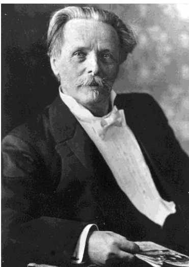
Karl May